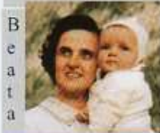
B e a t a G. Be- retta Molla

5 Febbraio 2012 XXXIV Giornata per la Vita